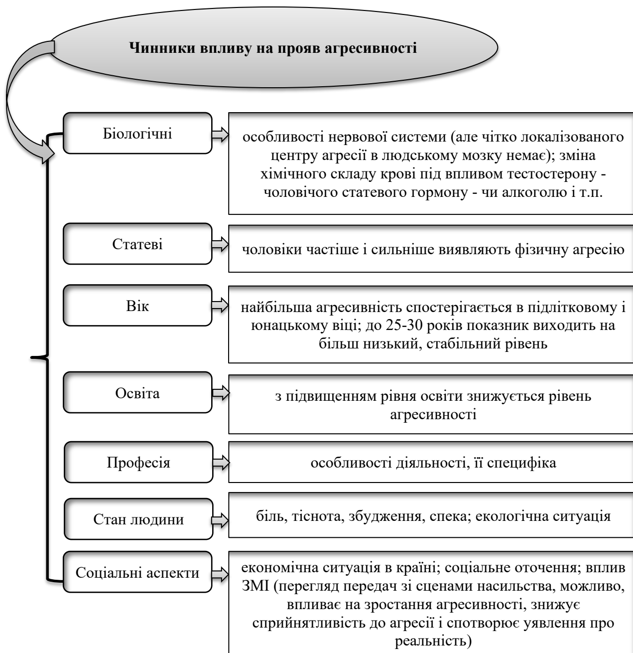
Рисунок 3 - Чинники впливу на характер в спосіб прояву агресії у молоді

порушенням морально-етичних норм, що містить елементи делінквентної або кримінальної поведінки з недостатнім урахуванням вимог реальності та зниженим емоційним самоконтролем).