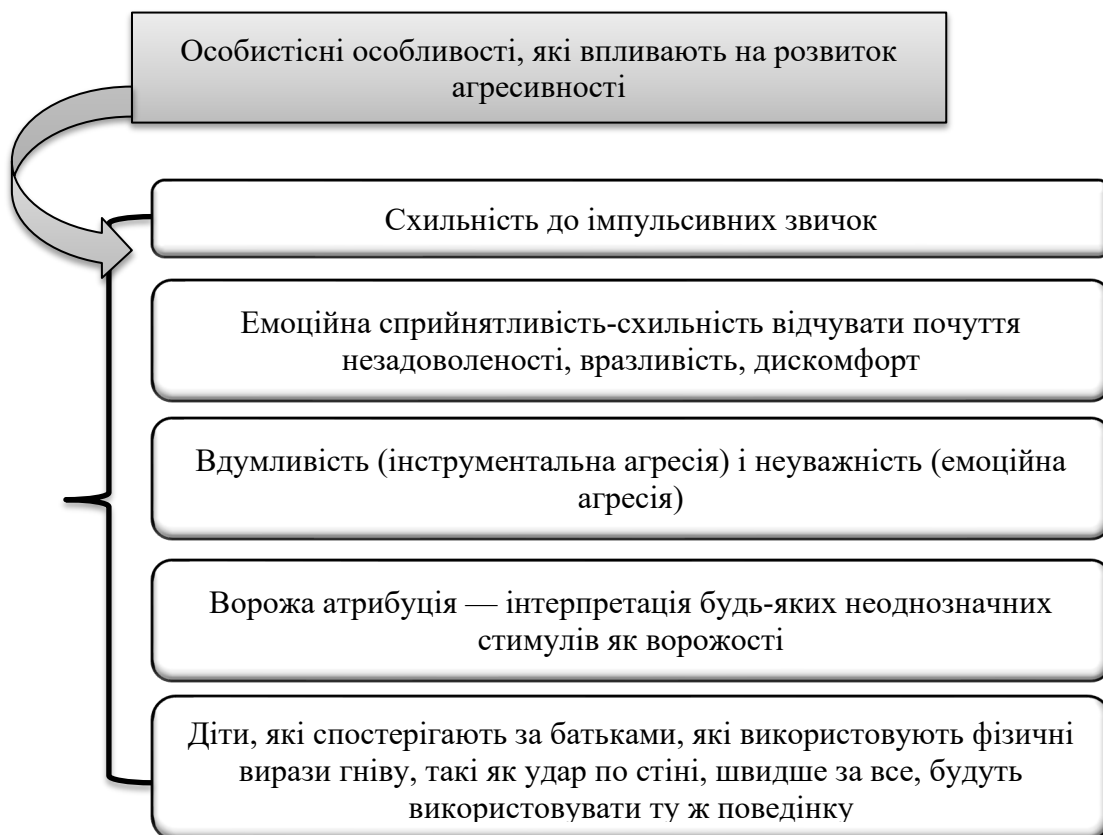
Рисунок 2 - Спектр особистісних особливостей, що зумовлюють розвиток агресивної поведінки в молодого віку

Аналіз наукової літератури дозволив виділити певний спектр особистісних особливостей, що зумовлюють розвиток агресивної поведінки в молодого віку (рис. 2).